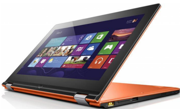
Premiul I Ultrabook Lenovo Yoga 2

Marea finală și acordarea premiilor 12 mai