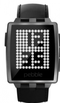
Premiul III SmartWatch Pebble