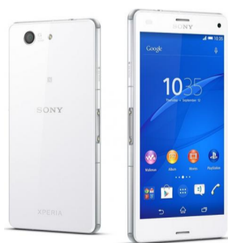
Premiul II Sony Z3 compact